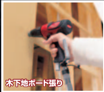
木下地ボード張り