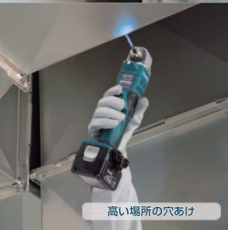
高い場所の穴あけ