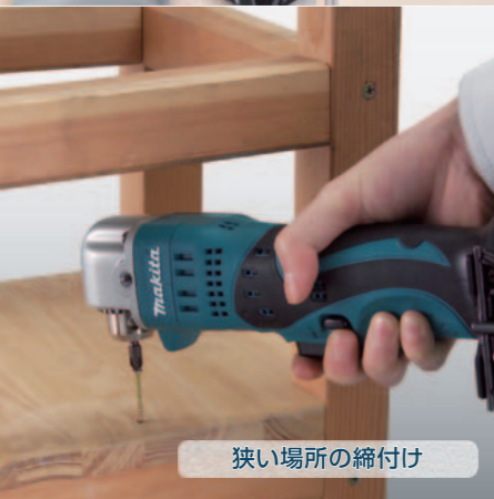
狭い場所の締付け