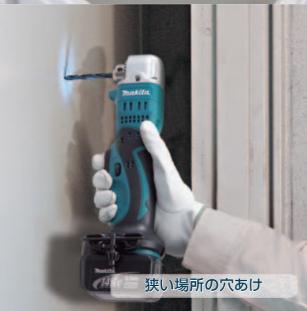
狭い場所の穴あけ