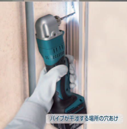
パイプが干渉する場所の穴あけ