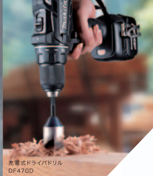
充電式ドライバドリル DF470D