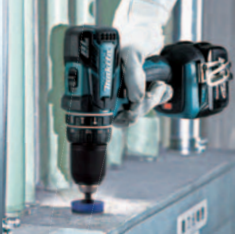
充電式震動ドライバドリル HP470D