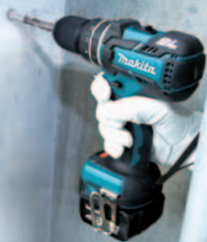
充電式震動ドライバドリル HP470D