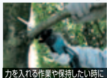
高い所や、狭い所の作業に