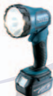
フラッシュライト ML185