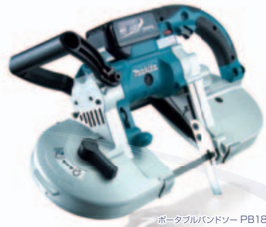
ポータブルバンドソー PB180D