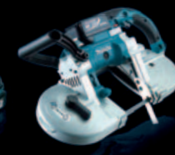
ポータブルバンドソー PB180D