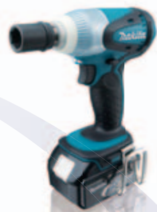
インパクトレンチ TW251D