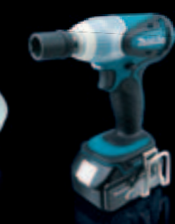
インパクトレンチ TW251D